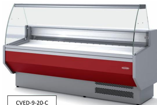
CVED-9-20-C Vitre bombée