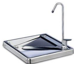
G61 Robinet courbé avec levier de contrôle mécanique. Bouton poussoir ou antiblocage à la demande.

Il est disponible en 230V-50 / 60Hz pour permettre une utilisation sur les navires et les stations off-shore