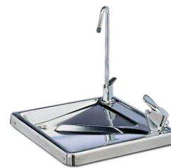
G63 - G61 Jet avec commande à pédale et robinet courbe avec levier de commande mécanique.