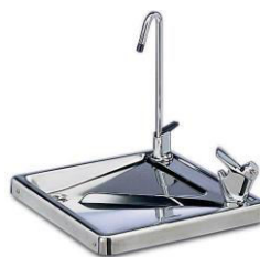
G62-G61 Combinaison d'un bouton poussoir mécanique et d'un robinet incurvé.