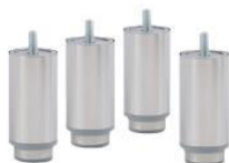
KIT DE 4 PIEDS REGLABLES EN HAUTEUR